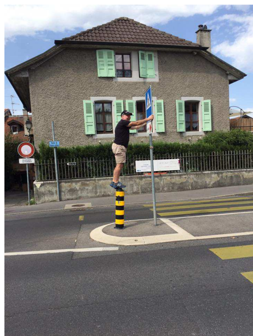
Le Président vise haut !!!!